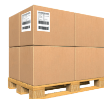
APL 60S 2 ETIKETTEN 3 Paletten/min*

Aufgrund unserer kontinuierlichen Verbesserungspolitik können sich unsere Produktspezifikationen ohne vorherige Ankündigung ändern.